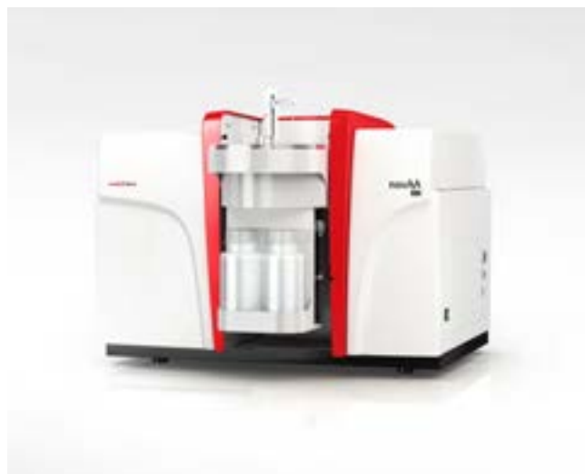
novAA 800 D für Flammen-, Hybrid- und Graphitrohrtechnik