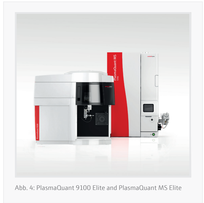
Abb. 4: PlasmaQuant 9100 Elite and PlasmaQuant MS Elite

Tabelle 4 enthält eine Übersicht über die Stärken und Limitierungen beider Techniken. Jede ICP-Technik hat Stärken und Schwächen. Geringere Matrixtoleranz und höhere Betriebskosten kompensieren die besseren Nachweisgrenzen von ICP-MS. Die Robustheit und höhere Matrixtoleranz von ICP-OES geht mit häufigerer Reinigung und sorgfältiger Konfiguration des Probenzuführungssystems einher.