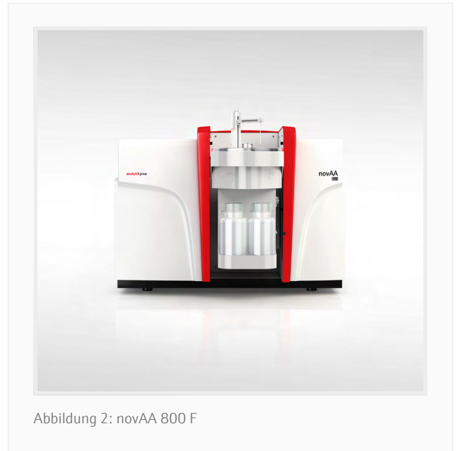
Abbildung 2: novAA 800 F

Das novAA 800 F für die Flammen-AAS ermöglicht eine schnelle und präzise Analyse des Kupfergehalts von Erzproben nach einem einfachen Aufschluss auf einer Heizplatte in Salpetersäure oder Königswasser. Bei gleichzeitiger Verwendung des AS-FD-Probengebers wurden sowohl die Benutzerfreundlichkeit als auch die Produktivität erheblich gesteigert, da der Probengeber (i) eine automatische Überbereichsverdünnung von Proben mit unbekanntem und schwankendem Kupferkonzentrationen und (ii) eine automatische Vorbereitung von Kalibrierstandards ermöglicht.